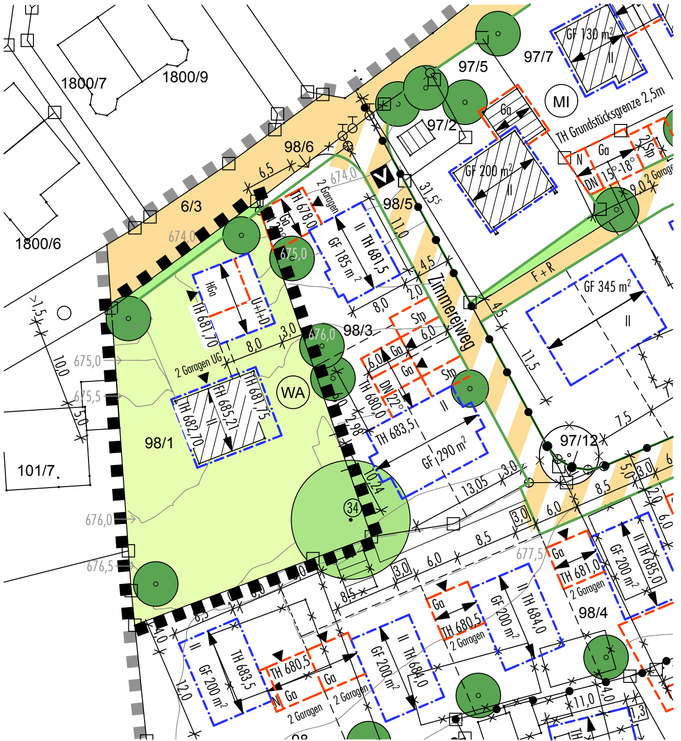
FlurNr.: 98/1 · Planzeichnung, Umgriff 11. Änderung M 1/500